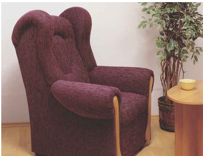
Brigita - vysoká sedací souprava s volitelnými područkami klasického nebo ušákového typu.